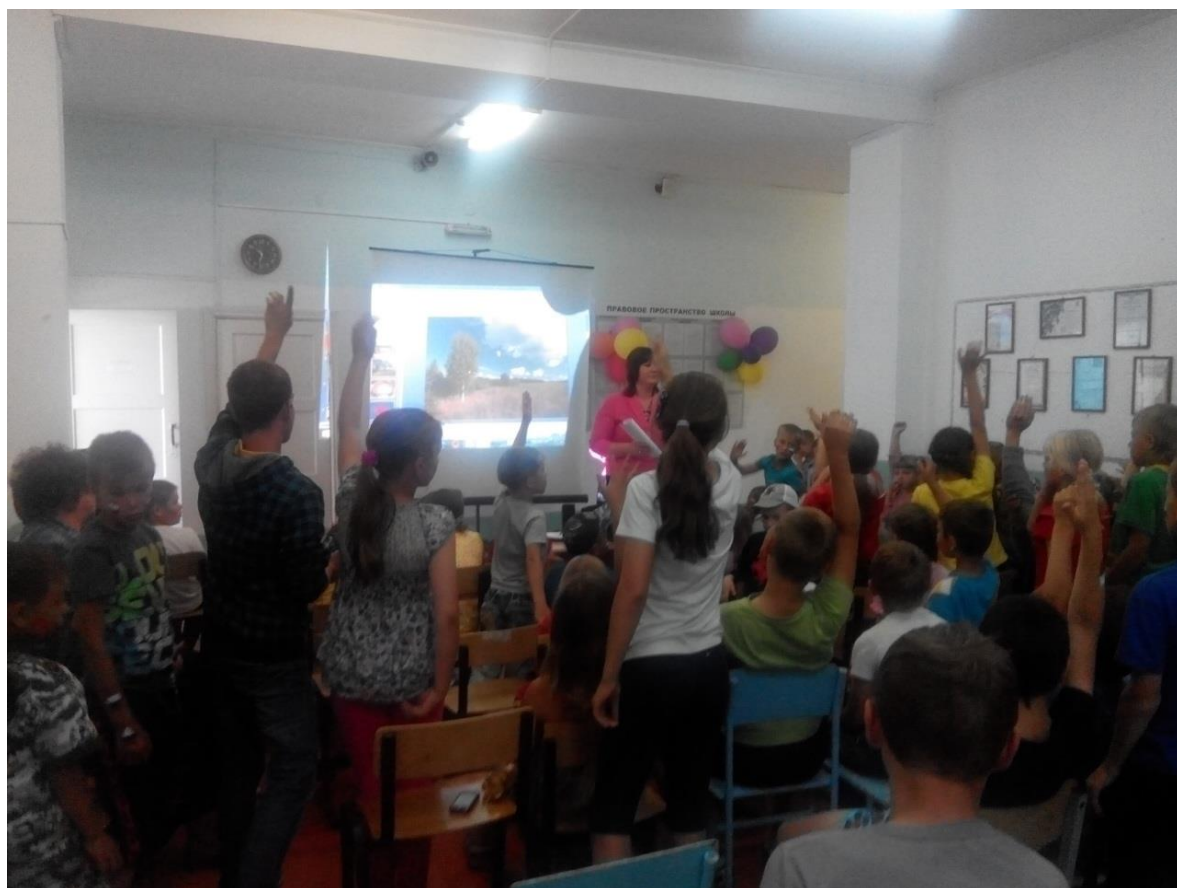
Пригородная школа Викторина