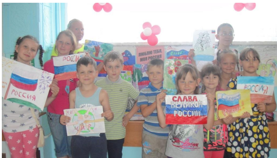
Верхотомская школа конкурс рисунков