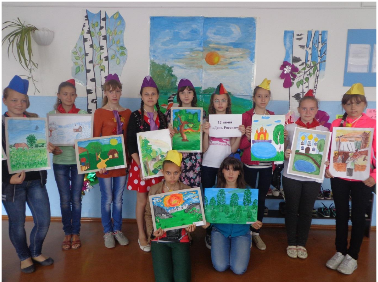
Ягуновская школа рисунки Моя Россия