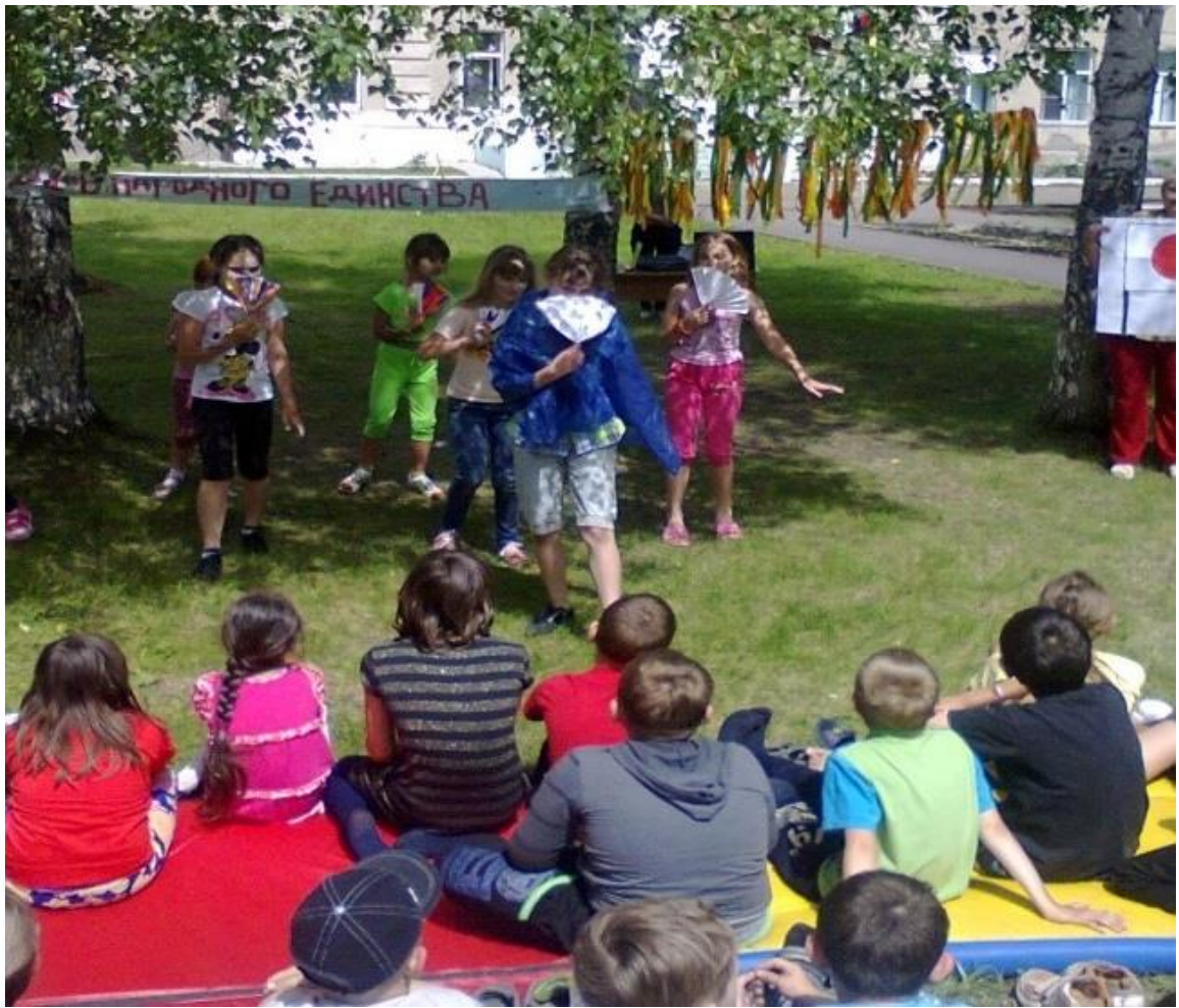
Берзовская школа национальные танцы