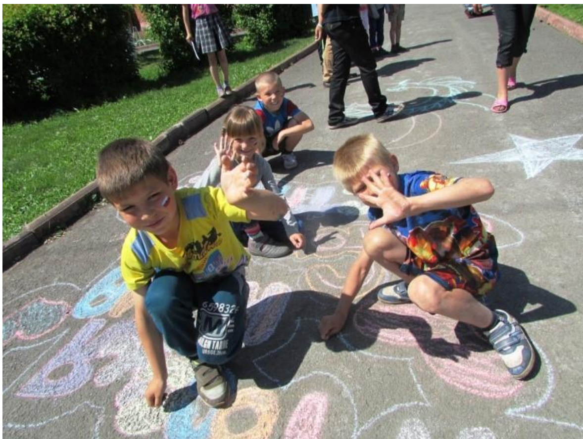
Берёзовская коррекционная школа интернат