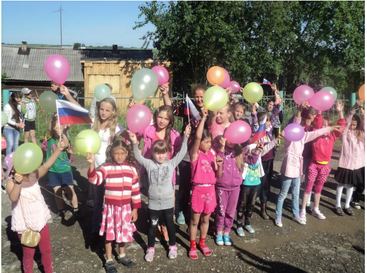
Барановская школа флешмоб