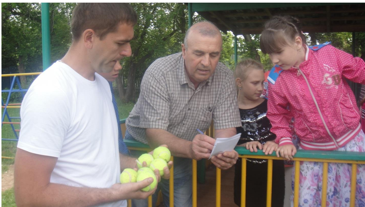
Верхотомская школа Военно спортивная игра