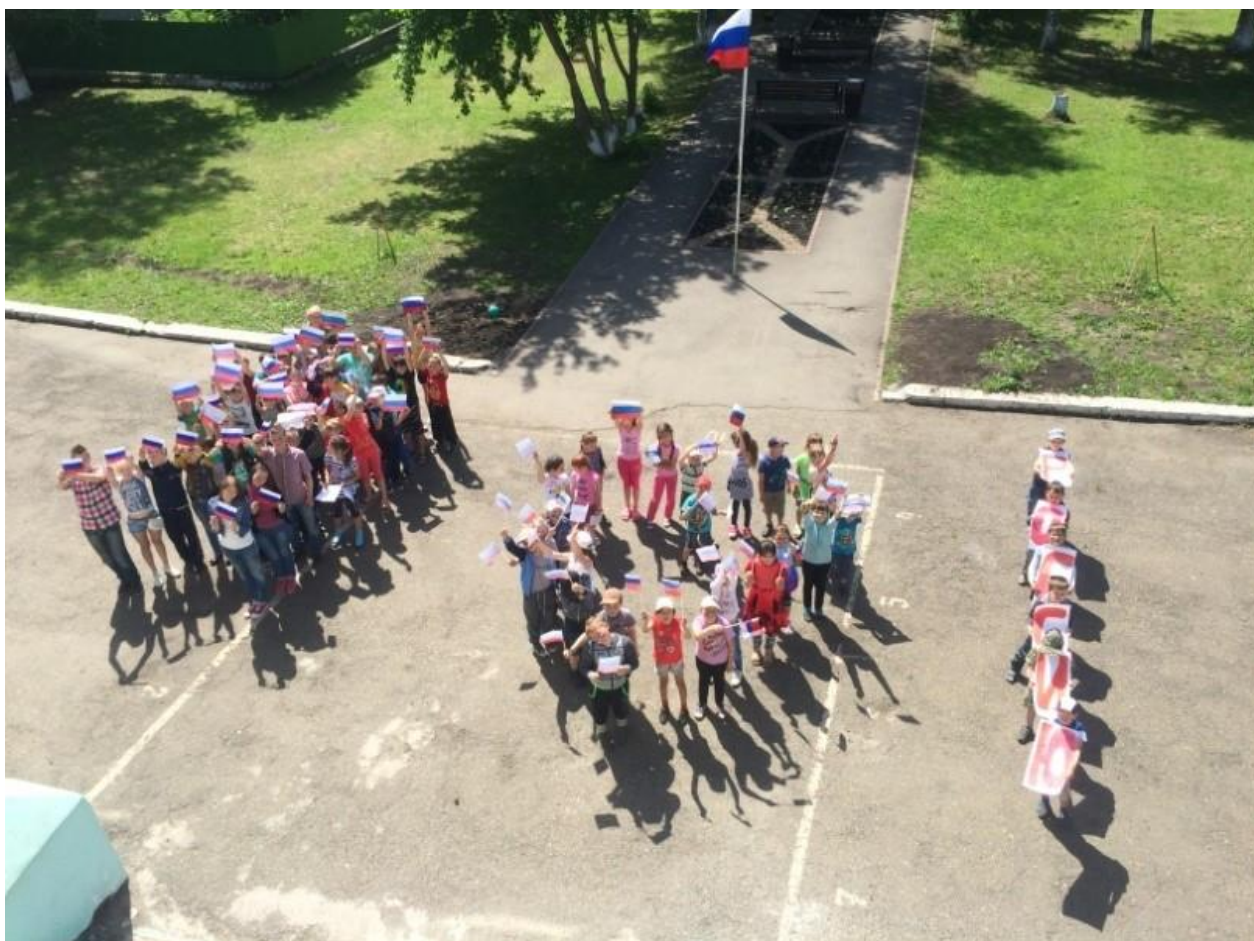
Берзовская школа флешмоб