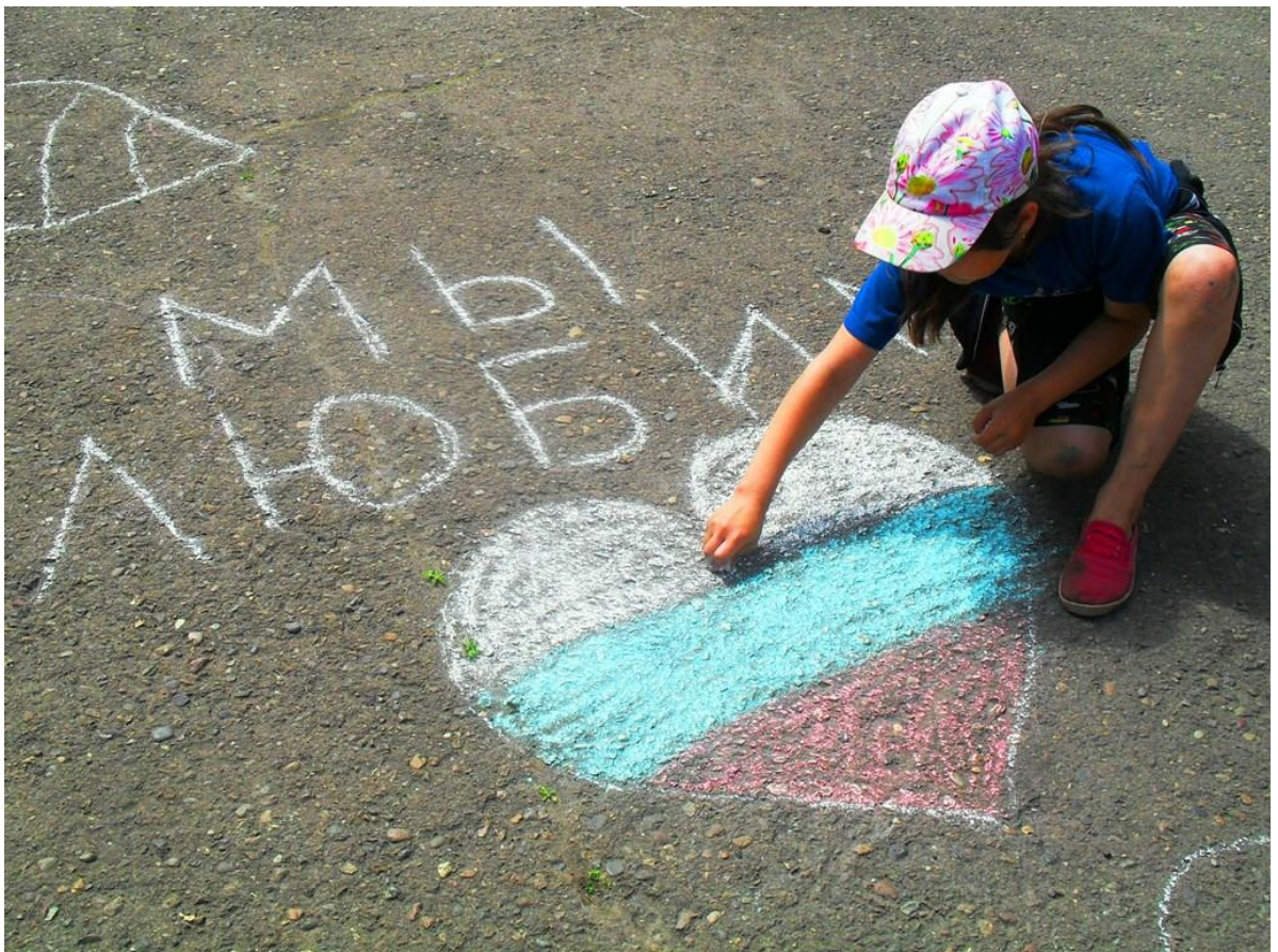
Береговская школа рисунки на асфальте