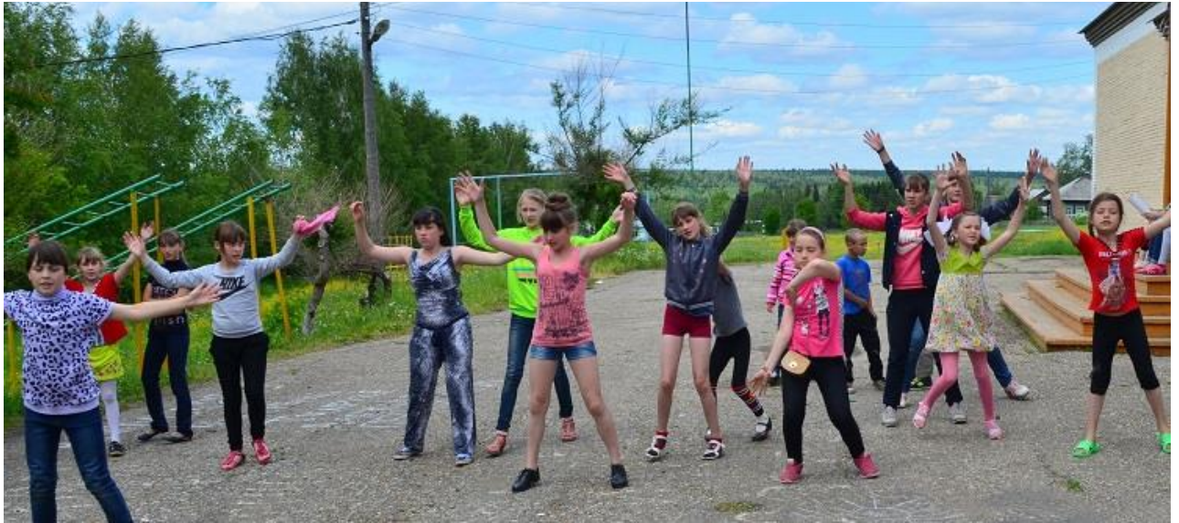
Арсентьевская школа коллективный танец