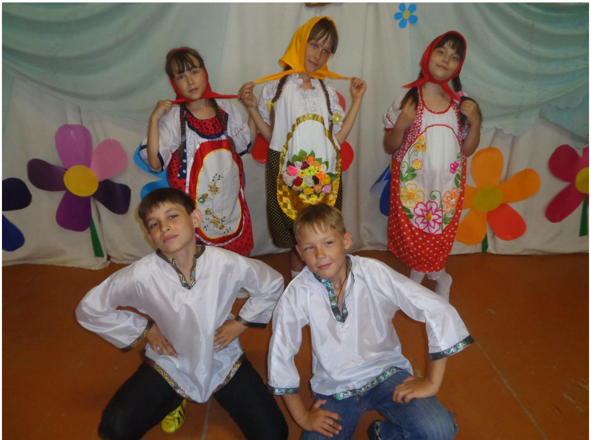
Ягуновская школа Русские народные традиции