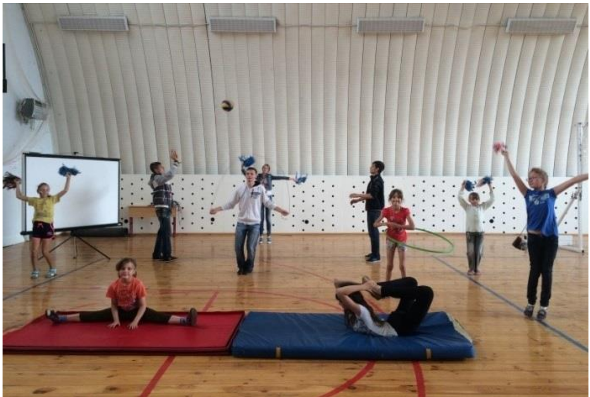
Берзовская школа соревнования