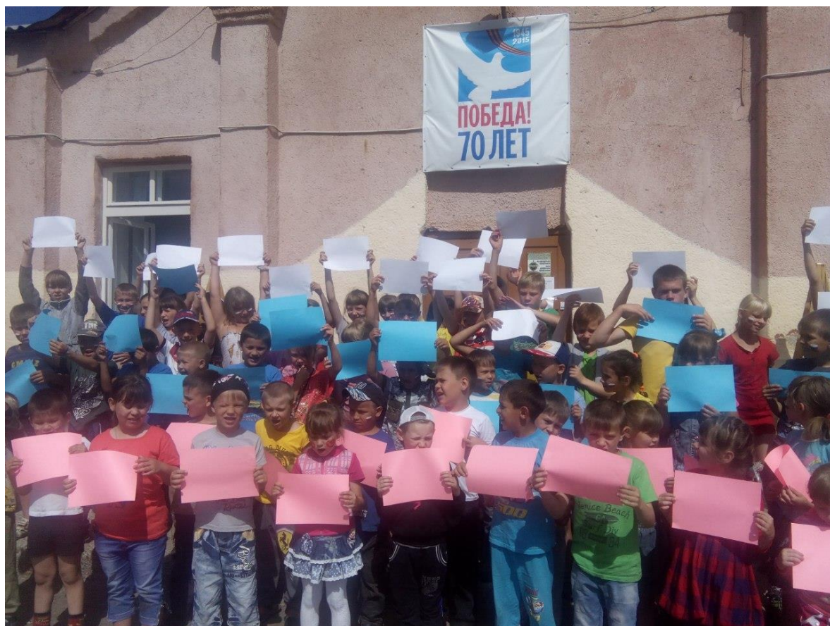
Пригородная школа флешмоб