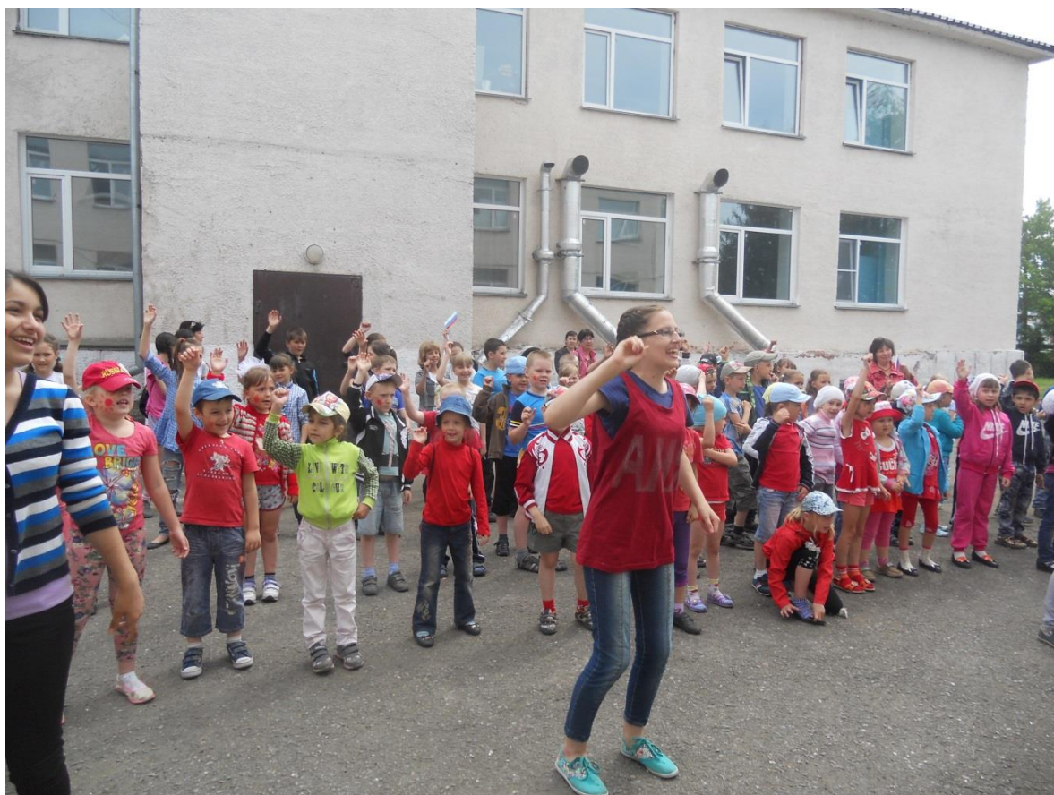
Новостроевская школа флешмоб