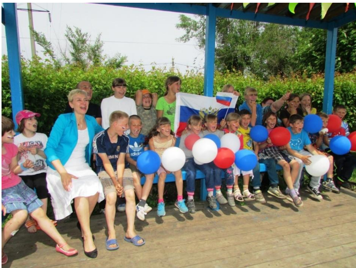
Берёзовская коррекционная школа интернат флешмоб