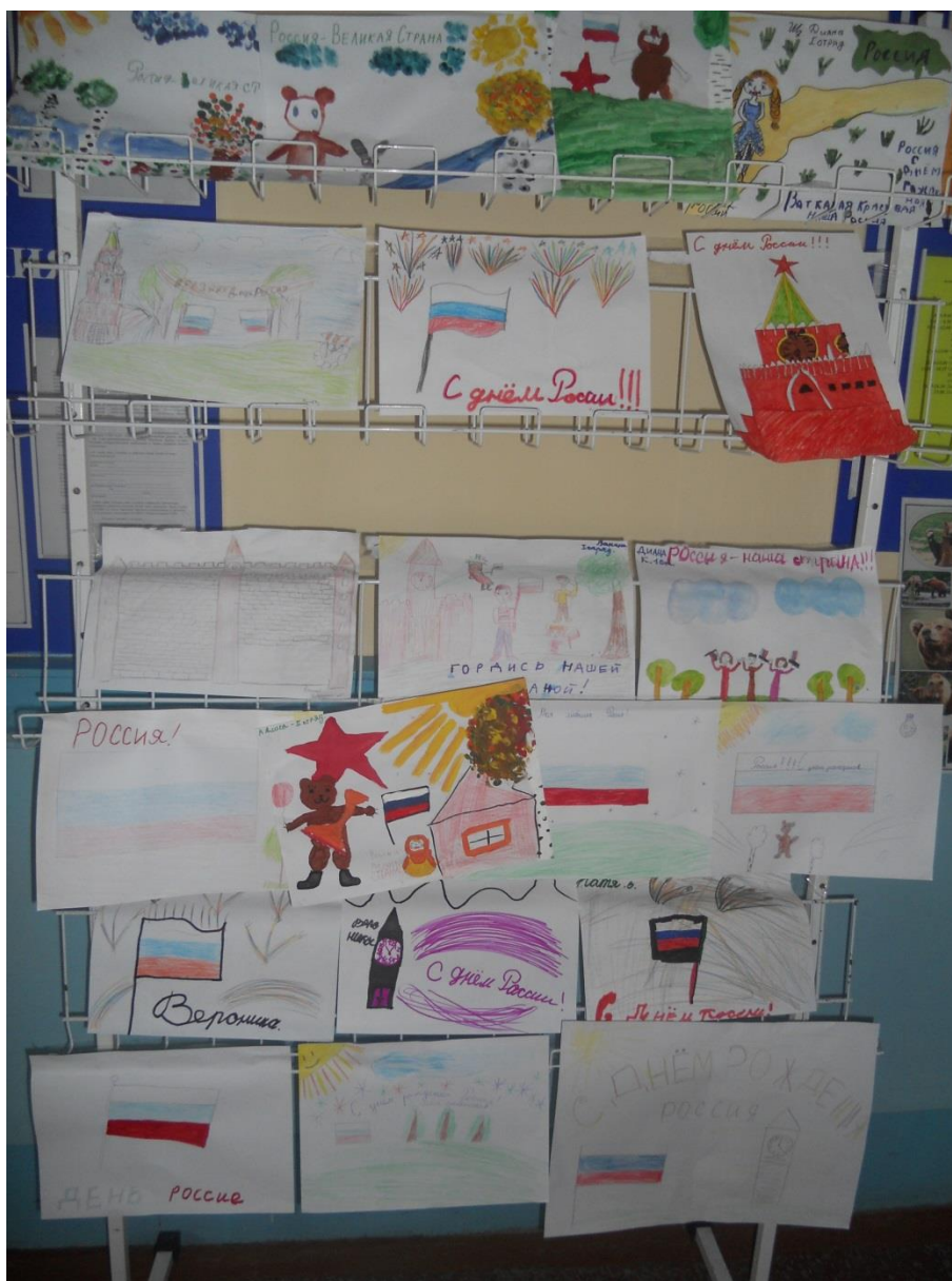
Новостроевская школа конкурс рисунков