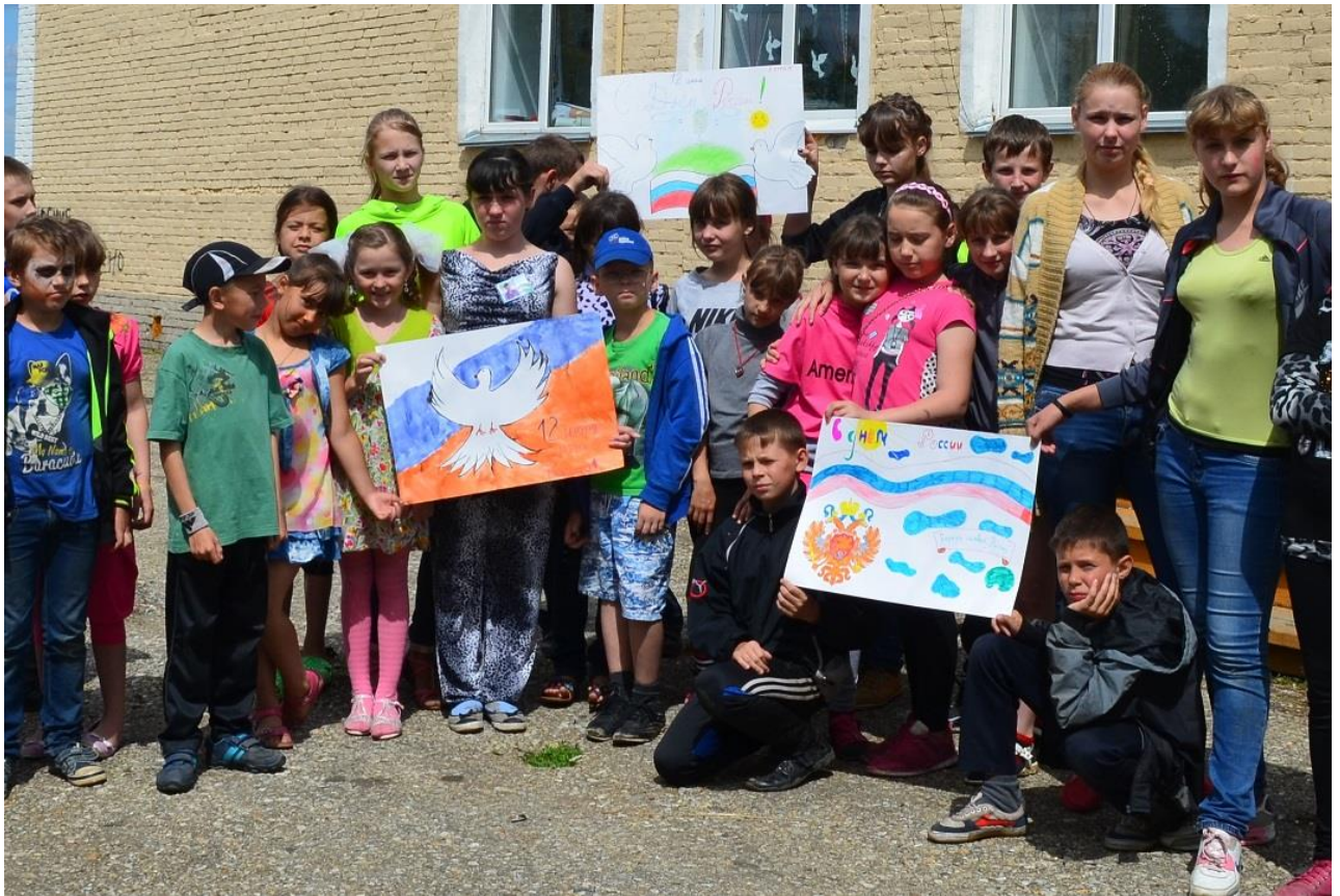
Арсентьевская школа конкурс плакатов