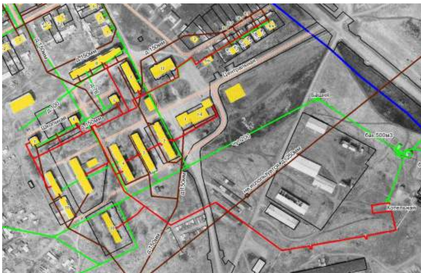
Рисунок 3 – Существующая зона действия котельной п. Звездный

Характеристики тепловых сетей указаны в таблицах 6, 7 и 8 соответственно.