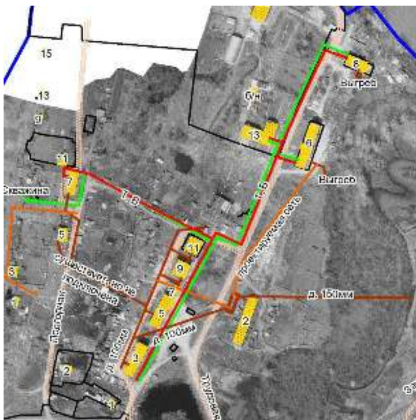
Рисунок 4 – Существующая зона действия котельной №1 д. Мозжуха